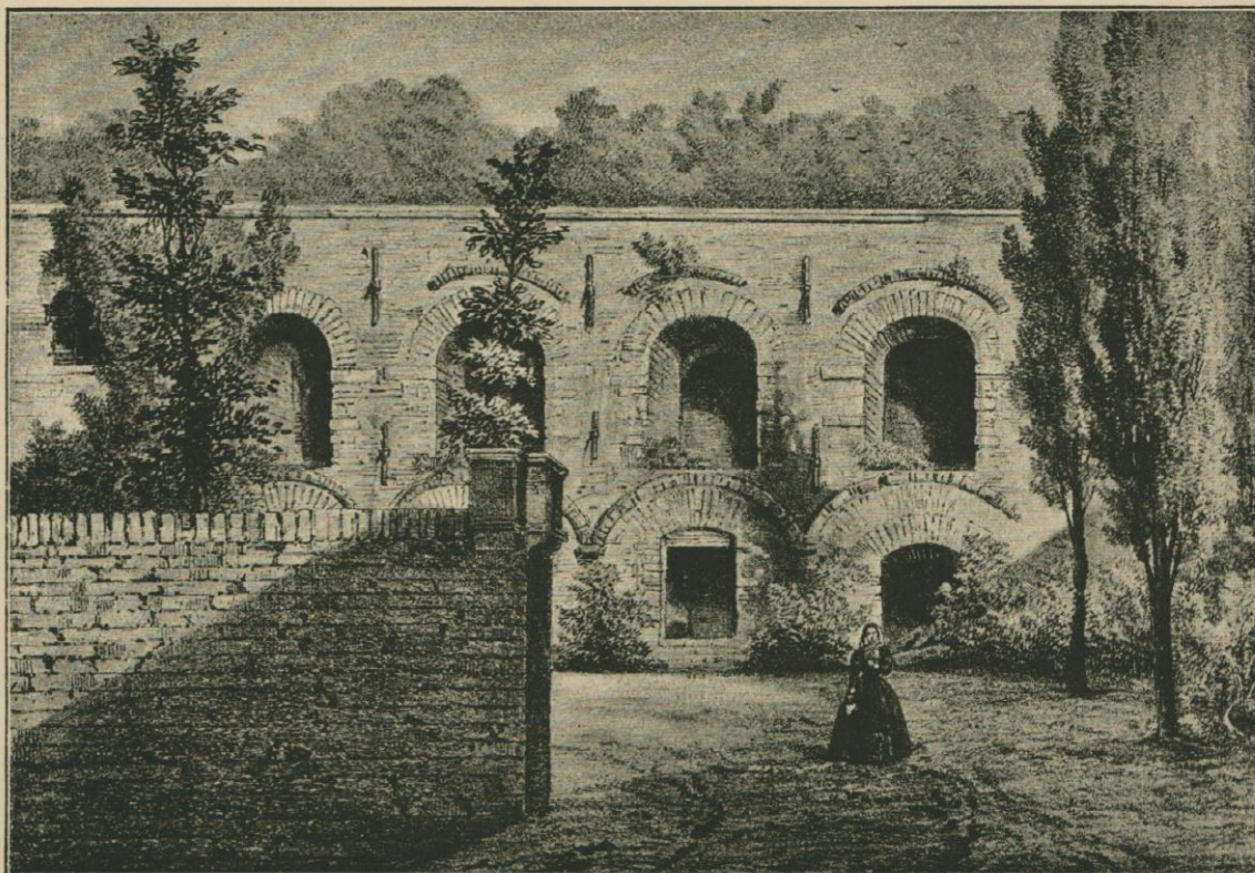
COUVENT DE BERLAIMONT (AUTREFOIS SITUÉ SUR L'EMPLACEMENT DE LA RUE DE LA RÉGENCE).